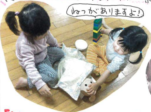
抱っこがありますよ!

ちゅーりっぷぐみに赤ちゃんの人形がきてからはお世話をする姿がよく見られます。自分達より小さい子をやさしくお世話しようとする気持ちが素敵ですね♡