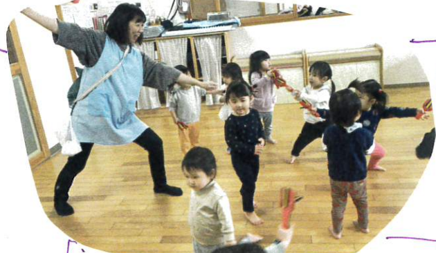
保育教諭を見ながら真似をして踊る事がとっても上手になってきました!!

「神樂かきせりたい...」保育教諭の例りに来てこっそり教えてくれるKちゃん。①「カリスマックスは?」Kちゃん「かくらー!!」鳴子を手に持ち、神樂の音に合わせて踊りました。初めて鳴子にみんなやる気満々!!ポーズを決めていましたよ!