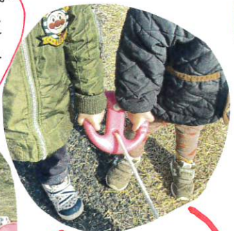
お散歩ロボフをしっかりとにぎって歩きます。